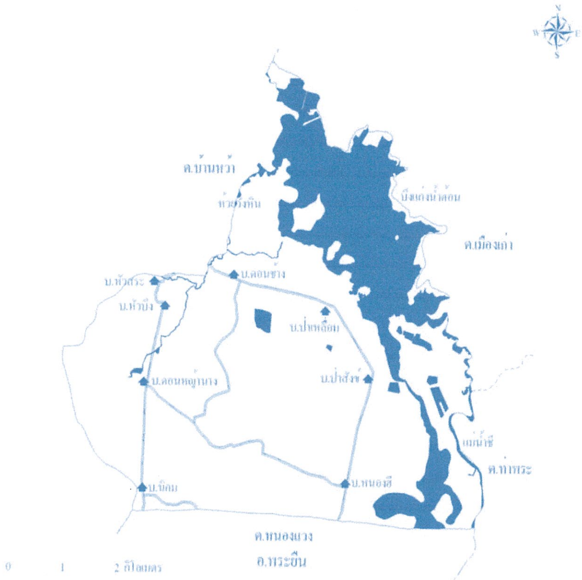
ภาพ แหล่งน้ำธรรมชาติบริเวณตำบลคอนช้าง